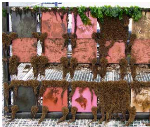
Transocean ejecuta ensayos de inmersión en serie de anti-incrustantes en todo el mundo.

preparación adecuada de la superficie suelen ser limitados.